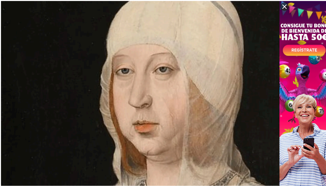
▲ Isabel la Católica, retrato de Juan de Flandes larazon / Isabel la Católica